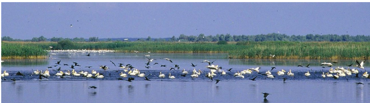
Witte pelikanen en aalscholvers Donaudelta

Marker Wadden kan voor blankvoorn, karper, jonge baars en brasem naast voor de exotische grondels een plek worden waar ze goed kunnen opgroeien. Dan moet er wel veel meer vegetatie komen in de vorm van riet en waterplanten. Ook structuur in de vorm van dood hout is belangrijk. En alles in open verbinding met het water van het Markermeer. Beelden van vissende kroeskoppelikanen en aalscholvers die we kennen uit de Donaudelta en sommige Griekse meren gaan altijd samen met de aanwezigheid van uitgestrekte rietvelden of overstromingsvlaktes. Schaal van het open water én de begeleidende moerassen zijn daarbij essentieel. Dynamiek in waterpeil waarbij de jonge vis opgroeit in de omgeving van het meer zijn cruciaal. Met Marker Wadden is deze ontwikkeling in gang gezet. Voor herstel van gradiënten en moerasontwikkeling zijn de projecten Trintelzand, vooroevers Houtribdijk en Oostvaardersoevers daarbij evenzeer van belang. In het westen van het meer zijn tal van mogelijkheden om een ecologische verbinding met de achterliggende polders te leggen, deels op te pakken via de dijkversterking tussen Hoorn en Amsterdam die aanstaande is. De waterplanten ontwikkeling daar is een belangrijke factor die op de schaal van het meer bijdraagt aan het herstel.